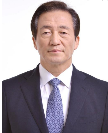
鄭夢準 (チョン・モンジュン)