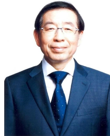
朴元淳 (パク・ウォンスン)