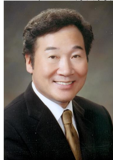
李洛淵 (イ・ナギョン)