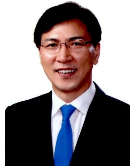
安熙正 (アン・ヒジョン)